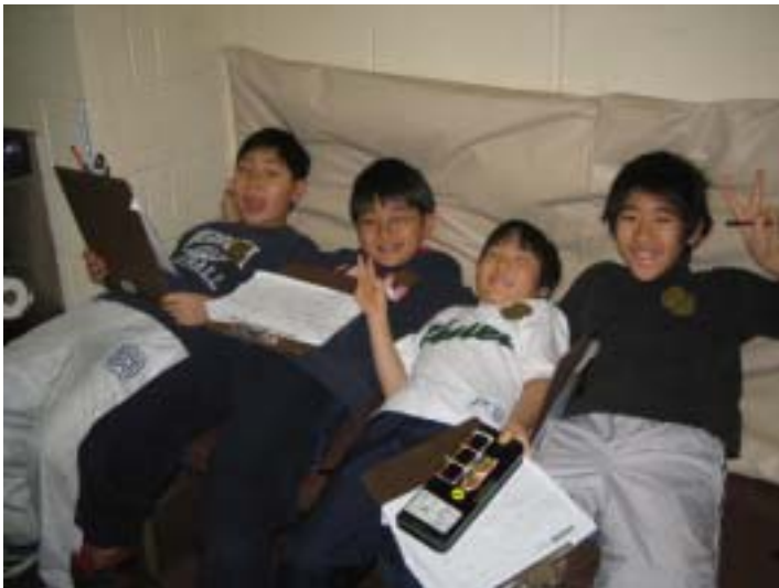
拘置所の中のベッド