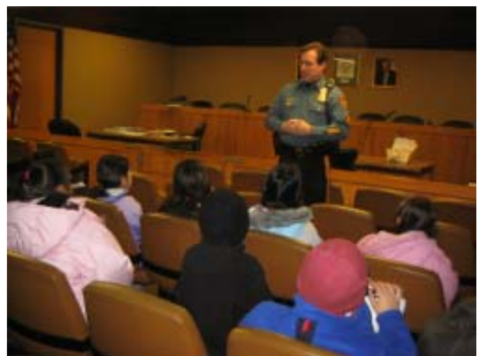
イングリウッドクリフ裁判所にて